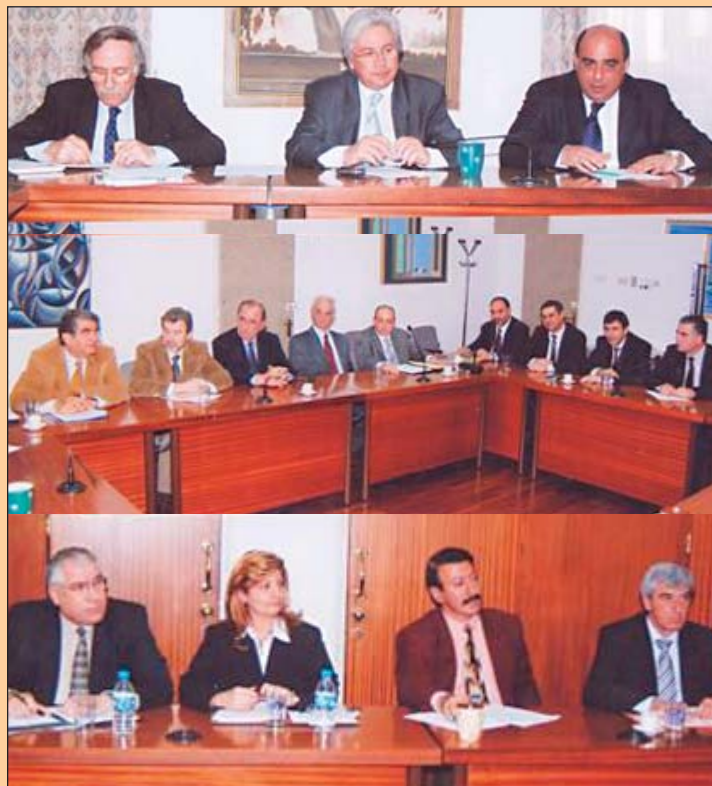
Στιγμιότυπο από τη συνάντηση του Υπουργού Εμπορίου, Βιομηχανίας και Τουρισμού κ. Αντώνη Μιχαηλίδη με αντιπροσωπεία του ΕΒΕ Λευκωσίας

Επί τάπητος οι ενέργειες του Υπουργείου για προώθηση Πιλοτικής Τεχνολογικής Κλινικής Τροφίμων