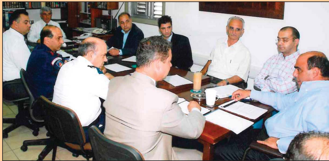
Στη φωτογραφία στιγμιότυπο από τη σύσκεψη στα γραφεία της VITATRACE NUTRITION