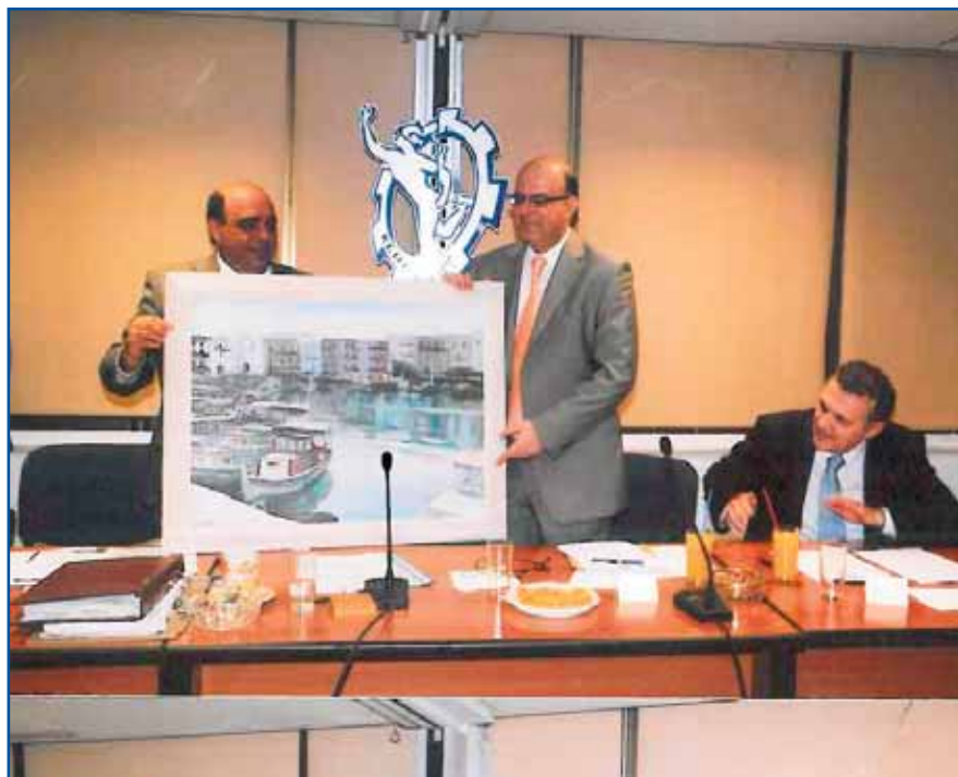
Στιγμιότυπα από την επίσκεψη του Προέδρου της Βουλής κ. Μάριου Κάρογιαν στο ΕΒΕΛ