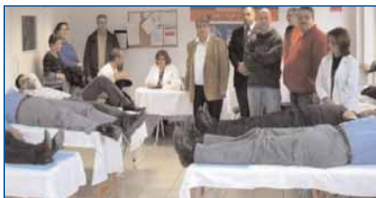
Στιγμιότυπα από την αιμοδοσία που οργάνωσε το ΕΒΕΛ

Την αιμοδοσία φιλοξένησε στις εγκαταστάσεις της η Εταιρεία Παπαφιλήπου και σ' αυτή παρέστησαν εκπρόσωποι των επιχειρήσεων που δραστηριοποιούνται στην περιοχή καθώς και του ΕΒΕ Λευκωσίας. Η αιμοδοσία με τη συνεργασία του ΕΒΕ Λευκωσίας και την Τοπική Επιτροπή Βιομηχανιών έχει καταστεί θεσμός καθώς διοργανώνεται για τρίτη συνεχόμενη φορά, ενώ γίνονται σχεδιασμοί ώστε να επεκταθεί και στις υπόλοιπες Βιομηχανικές Ζώνες και Περιοχές της Λευκωσίας, αλλά και της Κύπρου γενικότερα.