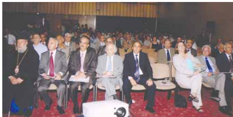
Όλοι έδωσαν το παρόν τους στη φετινή Γενική Συνέλευση