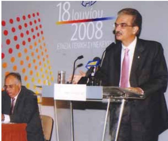
Ο Πρόεδρος του ΚΕΒΕ κ. Μάνθος Μαυρομμάτης