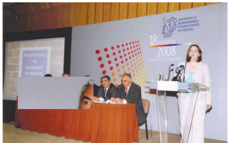
Η Δήμαρχος Λευκωσίας κ. Ελένη Μαύρου