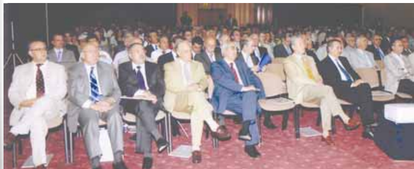
Ο Πρόεδρος της Βουλής, υπουργοί, βουλευτές και εκπρόσωποι κομμάτων, κρατικοί αξιωματούχοι και πολλοί επιχειρηματίες παρακολούθησαν με ενδιαφέρον την Ετήσια Γενική Συνέλευση