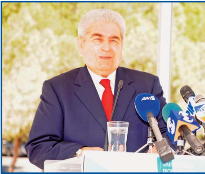
Ο πρόεδρος της Δημοκρατίας Δημήτρης Χριστόφιας απευθύνει χαιρετισμό