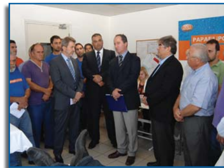
Στιγμιότυπο από την επίσκεψη του Υπ. Υγείας