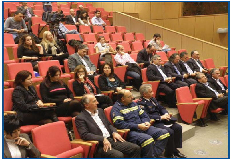
Στιγμιότυπα από την παρουσίαση του ηλεκτρονικού Χάρτη