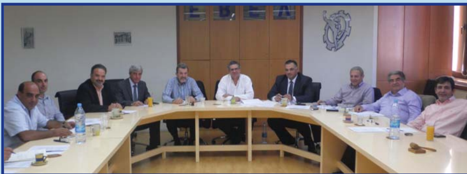
Στη φωτογραφία στιγμιότυπο από τη συνάντηση

Το ΕΒΕΛ ζητά από τους αρμόδιους να προχωρήσουν στην ίδρυση καζίνο στη Λευκωσία