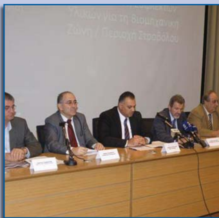
Στιγμιότυπο από την παρουσίαση