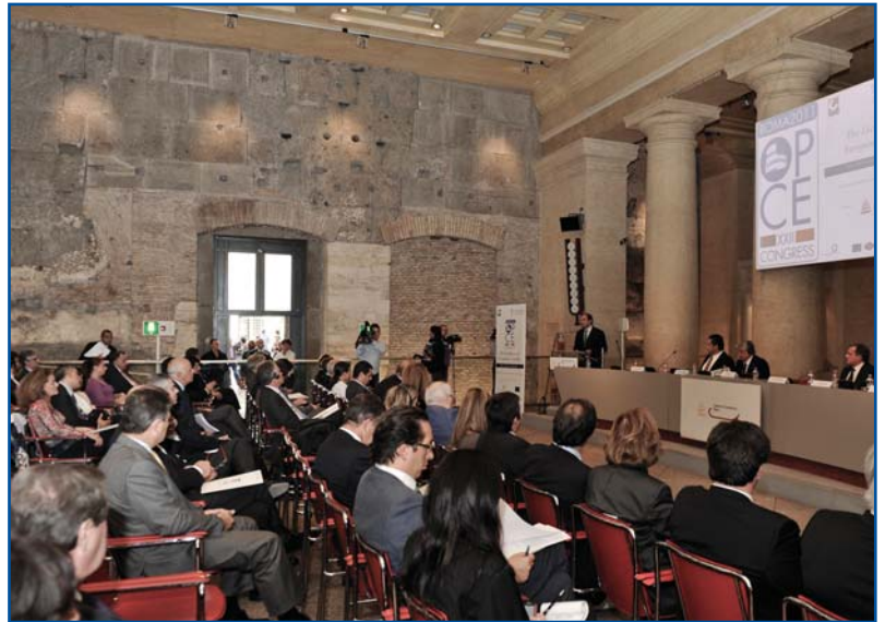
Στιγμιότυπο από το συνέδριο