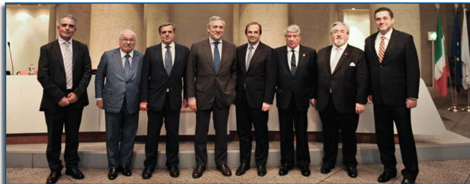
Μερικοί από τους εκπροσώπους των ευρωπαϊκών πρωτευουσών που συμμετείχαν στο συνέδριο