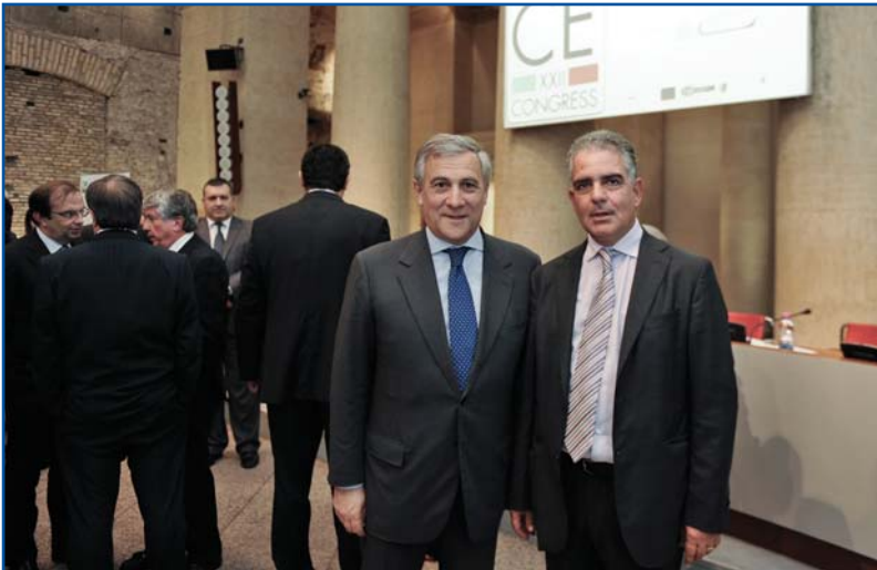
Ο Διευθυντής του ΕΒΕ Λευκωσίας κ. Σωκράτης Ηρακλέους με τον Αντιπρόεδρο της Ευρωπαϊκής Επιτροπής, αρμόδιο για θέματα βιομηχανίας και επιχειρηματικότητας κ. Antonio Tajani