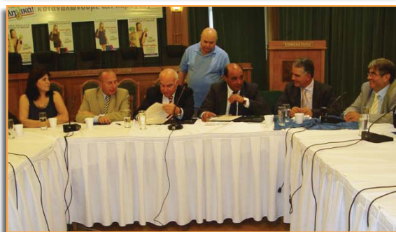
Στιγμιότυπα από την τελετή αδελφοποίησης των δύο επιμελητηρίων