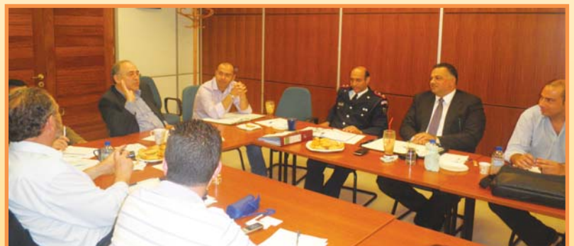
Στη φωτογραφία στιγμιότυπο από τη σύσκεψη στο Δήμο Στροβόλου

Μεταξύ άλλων συζητήθηκε η πρόοδος για τον καταρτισμό Επιχειρηματικού Σχεδίου Δράσης, καθώς και η δημιουργία ηλεκτρονικής βάσης δεδομένων.