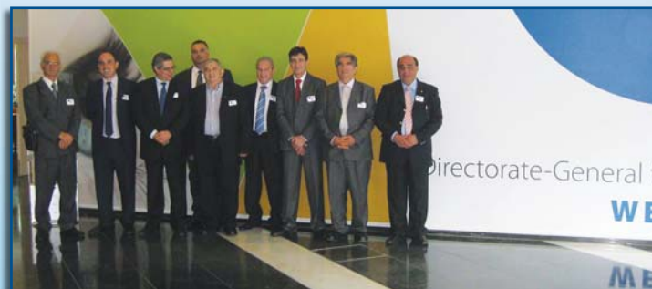
Στιγμιότυπο από την επίσκεψη στη Γενική Διεύθυνση Επιχειρήσεων και Βιομηχανίας της Ευρωπαϊκής Επιτροπής