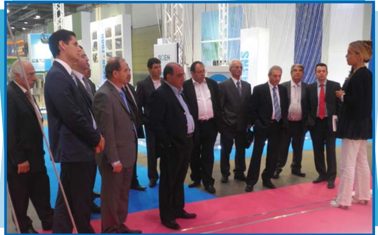
Στιγμιότυπο από την επίσκεψη στην εταιρεία Sioen

Συζητήθηκαν θέματα Βιομηχανικής Πολιτικής, η πολιτική για βιώσιμη ανάπτυξη, η Ευρώπη 2020 για έξυπνη, βιώσιμη και περιεκτική ανάπτυξη, η βιομηχανική καινοτομία και η πολιτική για τις Μικρομεσαίες