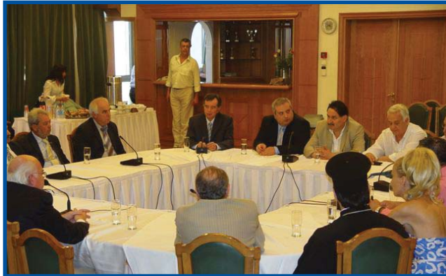
Στιγμιότυπο από τη συνάντηση

Βαθιά εκτίμηση μεταφέρω στον Ελληνισμό των Σερρών για την κατά μαρτυρία ενεργό συμμετοχή του στον Κυπριακό αγώνα. Η ανέγερση στην πόλη σας του μνημείου για τον τε-