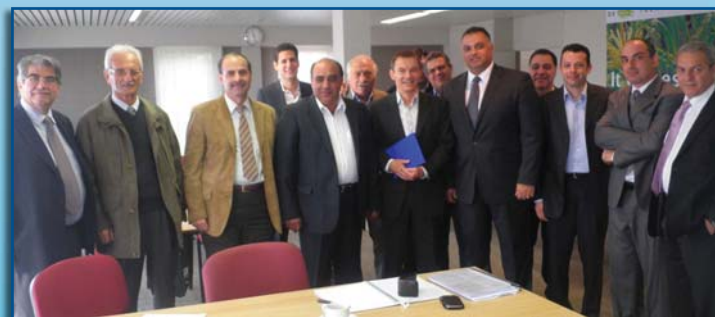
Από την επίσκεψη στην εταιρεία DE SAEDELEIR