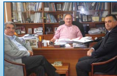
Συνάντηση ΕΒΕΛ με το Έπαρχο Λευκωσίας Σελ. 3