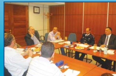
Μέτρα Ασφάλειας στις Βιομηχανικές Περιοχές από πιθανές πυρκαγιές Σελ. 3