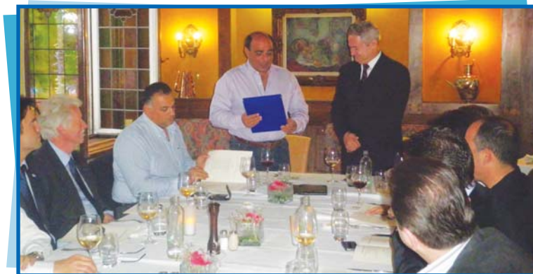
Στιγμιότυπο από το δείπνο με το Μόνιμο Αντιπρόσωπο της Κύπρου στην Ε.Ε.

Αναφέρονται ενδεικτικά οι επισκέψεις στη SIOEN INDUSTRIES που πρωτοπορεί στα επιχρισμένα τεχνικά υφάσματα, στην εταιρεία EXKI AGORA που είναι αλυσίδα εστιατορίων γρήγορης σίτισης με προτίμηση στα φυσικά προϊόντα, στην εταιρεία IMEC που πραγματοποιεί πρωτοποριακή έρευνα στην νανο-ηλεκτρονική (μεταξύ άλλων και για σκοπούς βελτίωσης της απόδοσης και κόστος των φωτοβολταϊκών/ηλιακών μονάδων). Τέλος στην εταιρεία DE SAEDELEIR που παράγει βιοαποσυντιθέμενα δάπεδα/χαλιά. Εξαιρετική θεωρήθηκε και η παρουσίαση του καθηγητή Geert Duysters, Επιστημονικού Διευθυντή στο Τεχνολογικό Πανεπιστήμιο του Αϊντχόβεν στην Ολλανδία αναφορικά με την πορεία της καινοτομίας και το ρόλο των ΜΜΕ στο σημερινό επιχειρηματικό περιβάλλον.