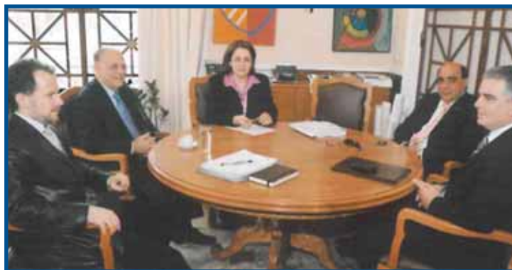
Λεπτομέρειες στη σελ. 3