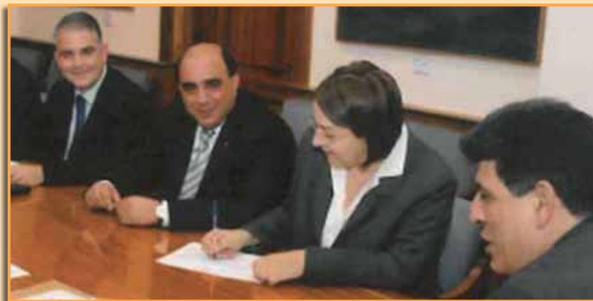
Λεπτομέρειες στη σελ. 2