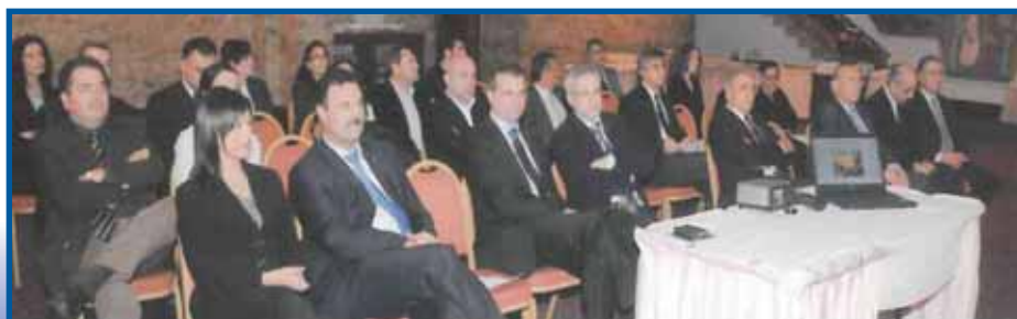
Στιγμιότυπο από τη συνάντηση